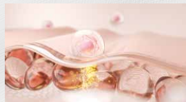
피부 재생 촉진